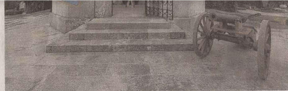
Blick auf das Mausoleum, das Dießener Kriegerdenkmal auf dem Friedhof St. Johann, das unter dem Namen Schacky Mausoleum bekannt ist.

Für die Fahnenweihe werden nahezu 80 Vereine mit ihren Fahnenabordnungen erwartet, kündigt Organisator Jürgen Zirch an, dass es ein solches „Fahnen-Ereignis“ nur selten gäbe und es deshalb als überaus eindrucksvoll gelte. Und beim Festzug sind es rund 1000 Personen, die mitmarschieren und ihre Vereine repräsentieren. „Von der Steiermark sind die Freunde aus Schladming dabei“, weist Zirch auf die langjährige Verbundenheit mit dem österreichischen Verein hin. Das Programm, mit dem die neue Fahne der Veteranen begrüßt wird, beginnt am Samstag um 17 Uhr: Die Vereine sammeln sich am Bahnhof und