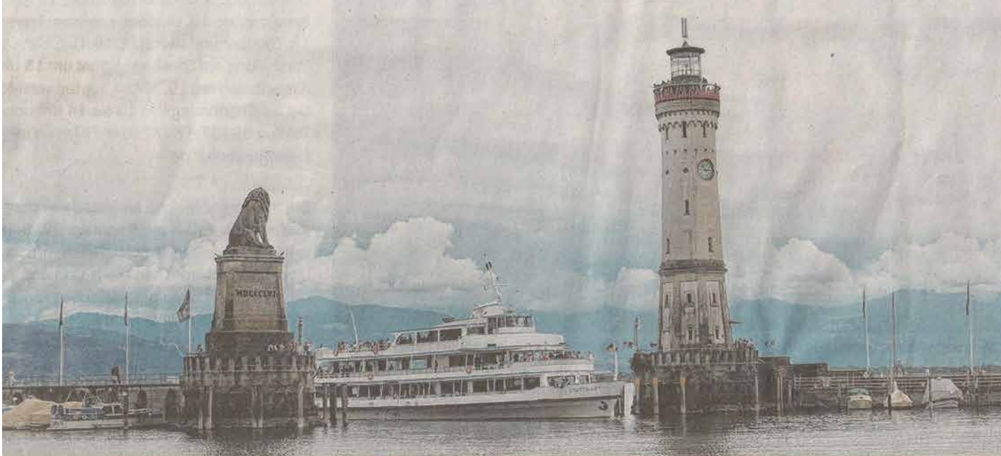
Der Neue Leuchtturm am Bodensee ist der südlichste Leuchtturm Deutschlands. Er befindet sich in Lindau, wo die Reisenden vom Ammersee bei ihrem Aus-

nen Kaffee direkt am Ufer, das Highlight war der Neue Leuchtturm. Der Neue Leuchtturm steht als südlichster Leuchtturm Deutschlands in Lindau im Bodensee und ist damit auch der einzige Leuchtturm in Bayern. Er hat eine Höhe von 33 Metern und am Sockel einen Umfang von 24 Metern. Er ist einer der wenigen Leuchttürme, die eine Uhr in der Fassade besitzen. Er wurde 1856 in Betrieb genommen. Nach dem herrlichen Tag ging es abends wieder Richtung Dießen und das Schönste, was man hören konnte war „Mei, des war ein scheener Dog“ (pb)